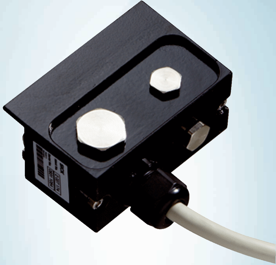
SX0A-B1310B S3000 sistem soketi